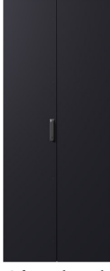
Çift Metal Kapak