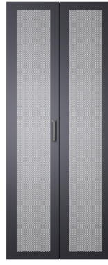
Çift Perfore Kapak