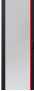
Tek Cam Kapak