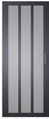
Tek Perfore Kapak