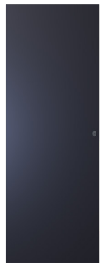
Tek Metal Kapak