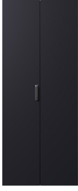
Çift Metal Kapak