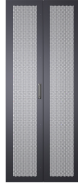
Çift Perfore Kapak