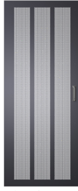
Tek Perfore Kapak